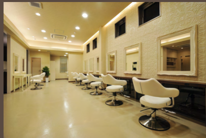
R's Court(吉野店) ☎ 099-243-0010