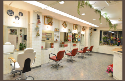
fars (天文館店) ☎ 099-226-1261