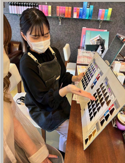
▼ 営業中 お客様とカウンセリング