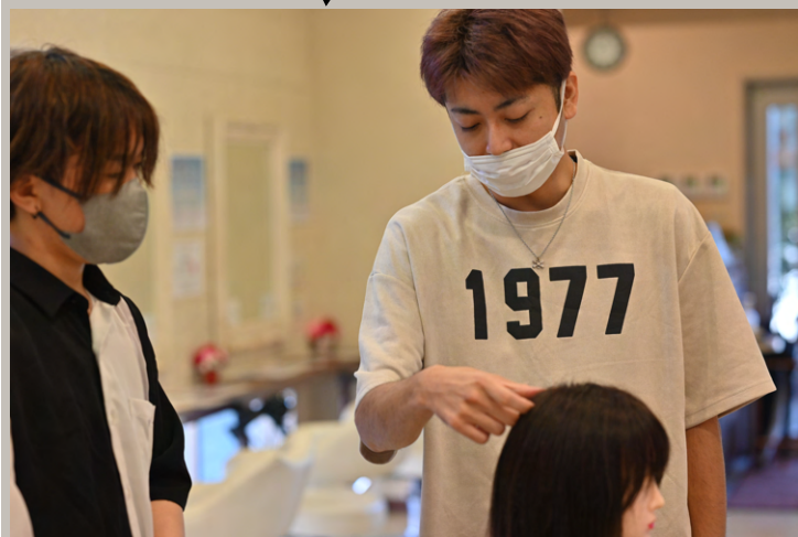
▼ 朝のカットレッスン