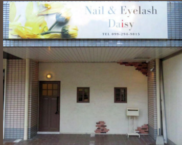
Nail&eyelash Daisy (照国店) ☎099-294-9815