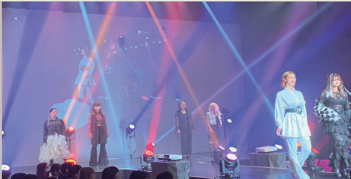
▲ ライカホールにてヘアショー 2023