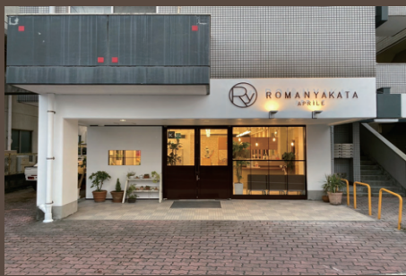
APRILE (谷山店) ☎ 099-260-3080