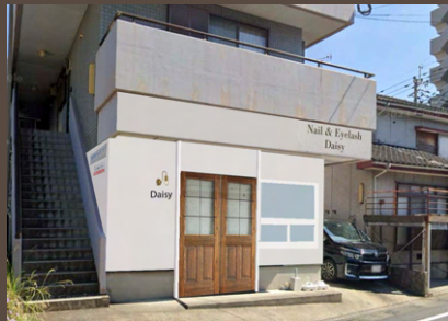
Nail&eyelash Daisy (谷山店) ☎099-821-7091