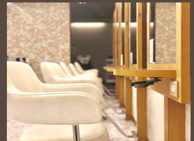
CINQ (伊敷店) ☎ 099-220-8818